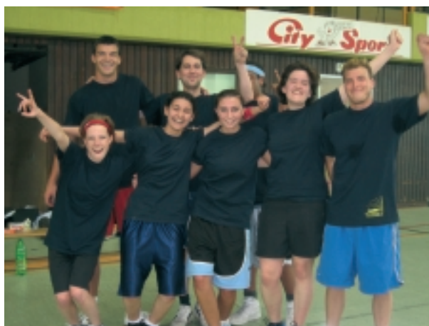
Das exilio-Team jubelt über den 2. Platz beim Basketball.

Die Auszubildenden der Deutschen Bahn organisierten am 29. April 2006 in Limburg an der Lahn ein Basketball-Spiel zugunsten von exilio e.V. Außerdem wurde ein Freiwurf-Contest veranstaltet. Ein Höhepunkt des Events war die Fuldaer Drum and Pipe Band „Targe of Gorden“, die ihre mu-